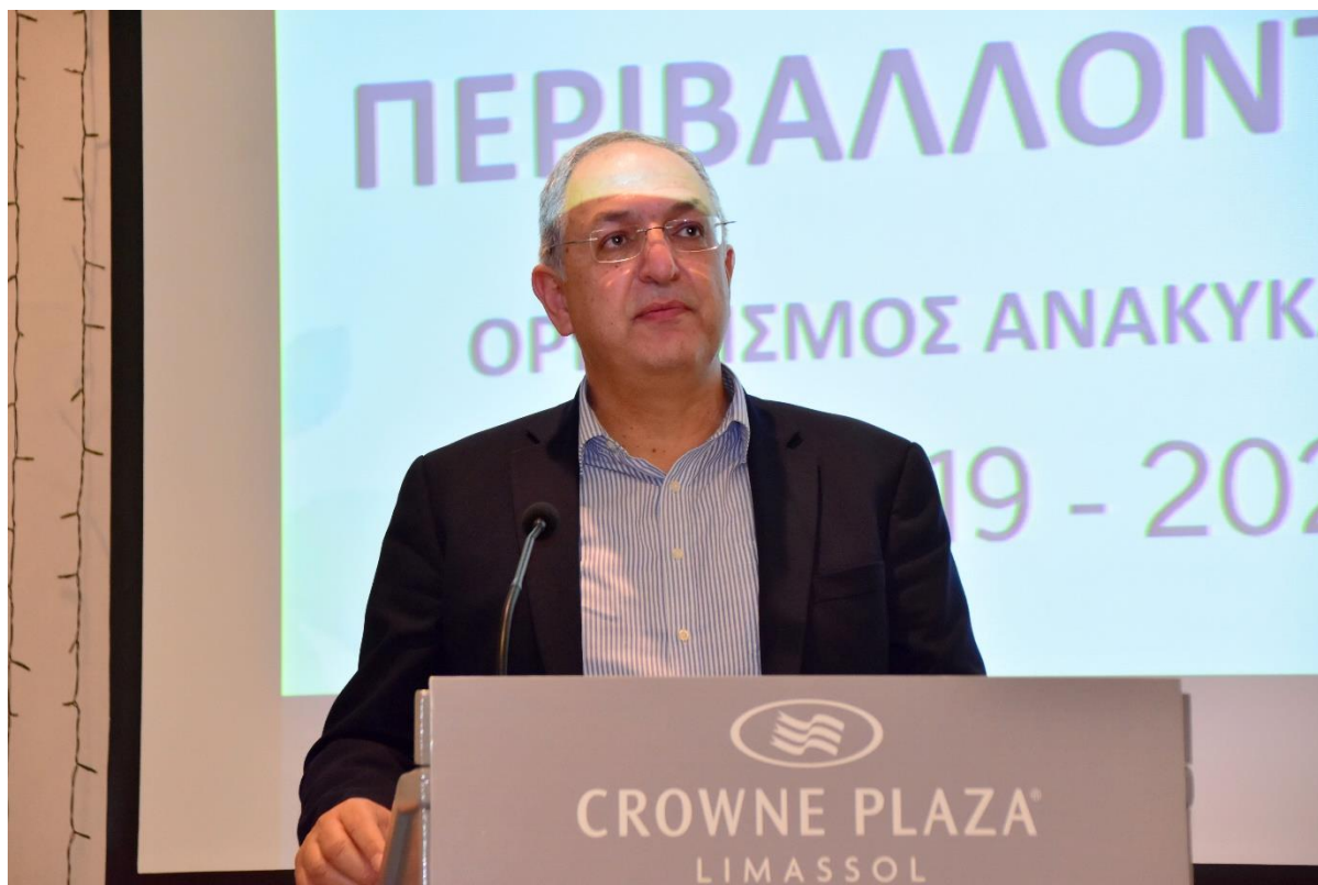
Εικόνα 1: Ομιλία τέως Υπουργού Γεωργίας, Αγροτικής Ανάπτυξης και Περιβάλλοντος, κ. Κώστα Καδή