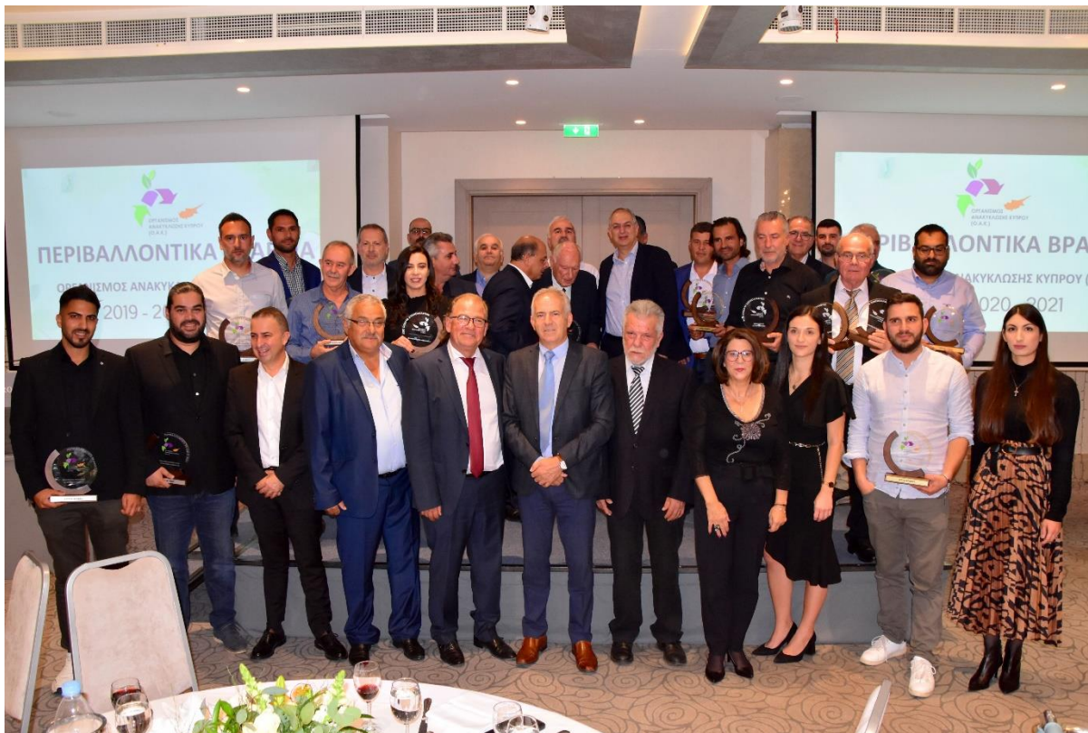
Εικόνα 2: Αναμνηστική φωτογραφία βραβευθέντων και παρευρισκομένων