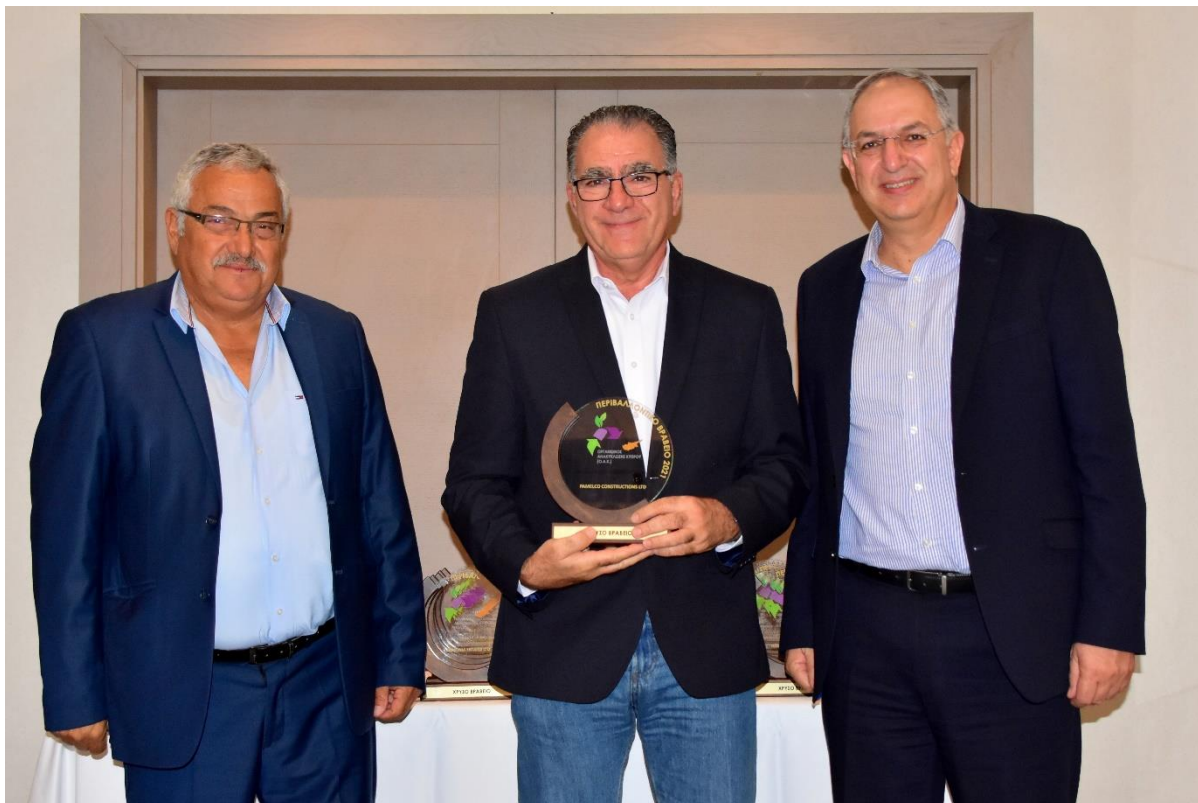
Εικόνα 4: Βράβευση PAMELCO CONSTRUCTIONS LTD και για τις τρεις χρονιές 2019 - 2020 - 2021