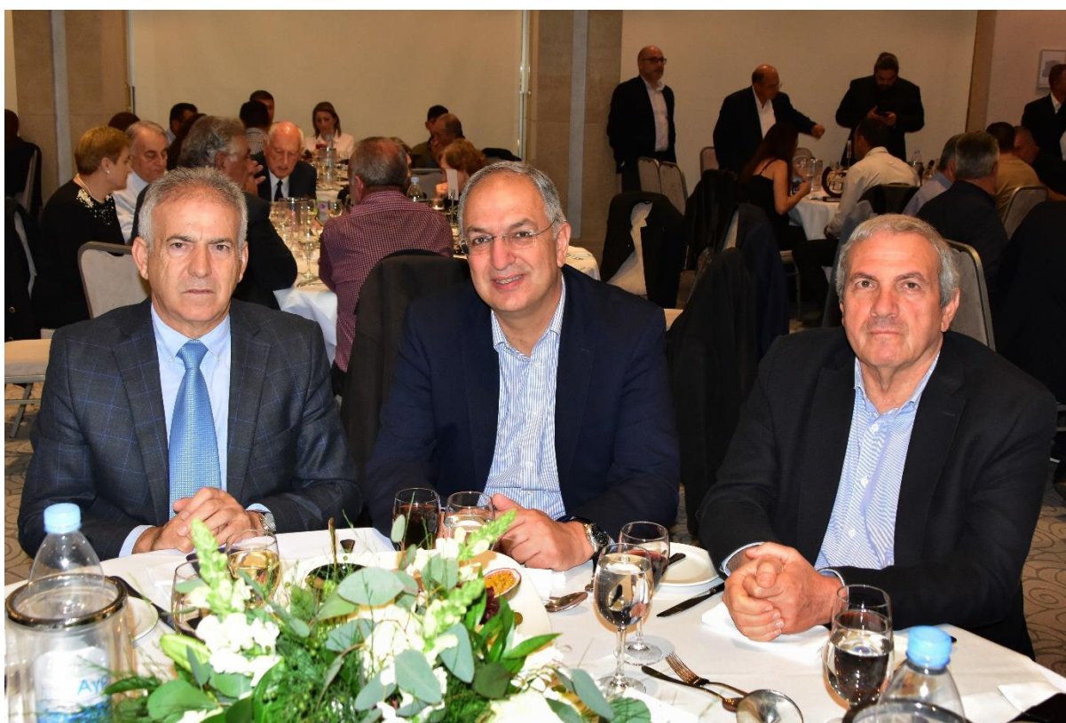
Εικόνα 3: Έπαρχος Λεμεσού, κ. Μάριος Αλεξάνδρου - Υπουργός Γεωργίας, Αγροτικής Ανάπτυξης και Περιβάλλοντος, κ. Κώστας Καδής - Πρόεδρος Κοινοβουλευτικής Επιτροπής Περιβάλλοντος, κ. Χαράλαμπος Θεοπέμπτου